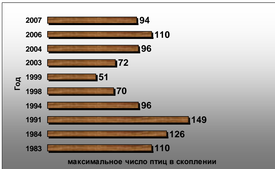
Рис. 1. Динаміка максимальної численності птахів Ізюмського передльотного скоплення по рокам

Максимальное количество птиц в предотлетной группировке варьирует – в разные годы здесь было от 75 (2003 г.) до 150 (1991 г.). Причем этот показатель в последние годы снижался. В период с 1981 г. по 1991 г. эти показатели распределялись следующим образом: в 1981 г. здесь было 150 журавлей; в августе 1982 г. – около 100 (Кривицкий, 1989); 1.08.1983 г. – 110 особей (Есилевская и др., 1986), в 1984 г. – 126; в 1991 г. – до 150 особей (Атемасова и др., 1993). В последующие годы этот показатель держался на уровне 90–96 особей (за исключением 2006 г. – 110 особей) (рис. 1).