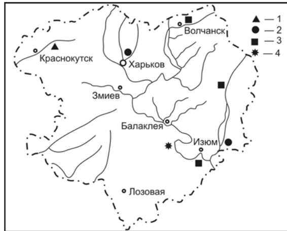
Рис. 3. Местонахождения Platismatia glauca (1), Xanthoria ukrainica (2), Lecania fuscella (3), Polysporina simplex (4)