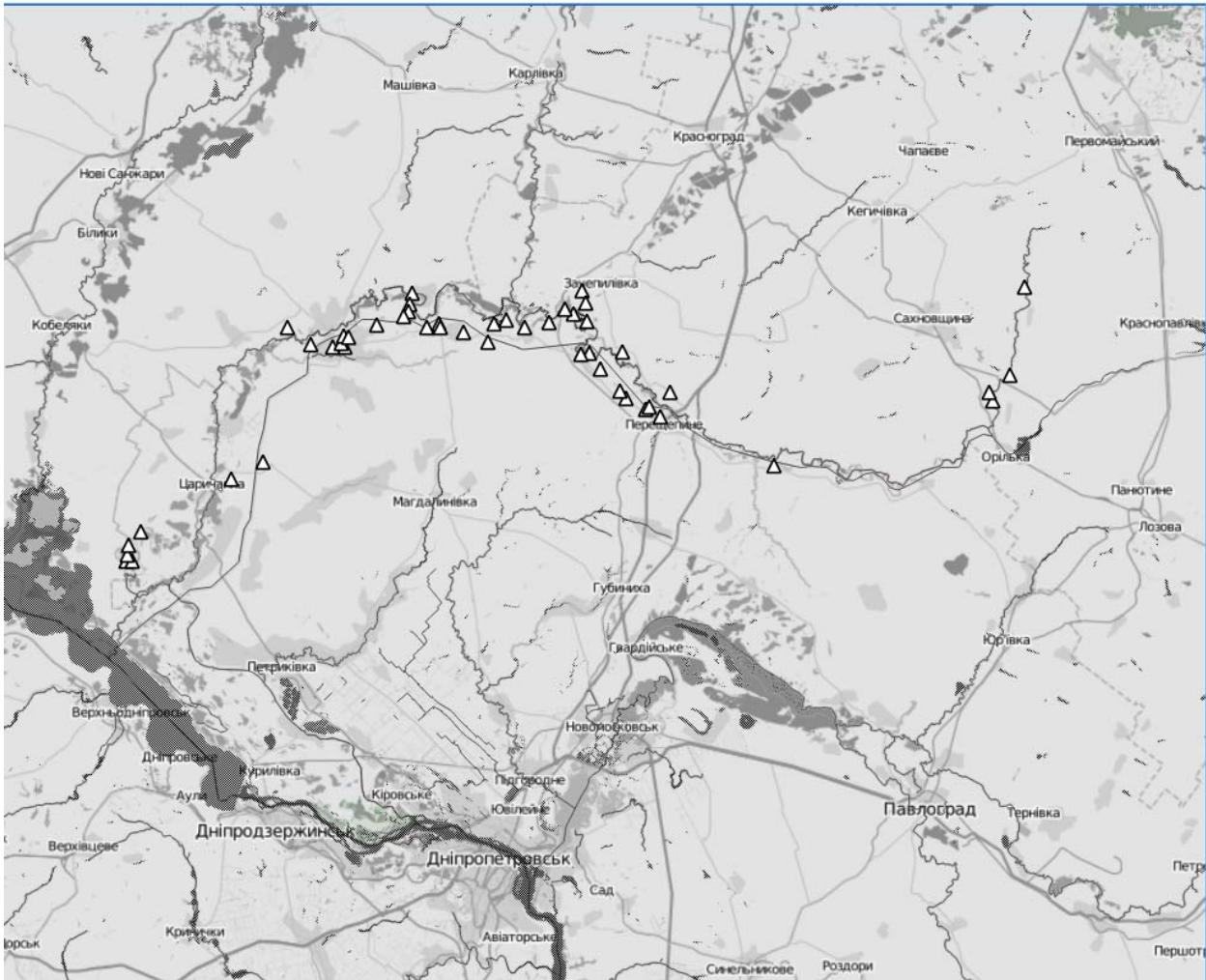
Рис. 1. Розташування ділянок, на яких проводили обліки водоплавних і водно-болотяних птахів у Приореллі у 2005–2017 рр.