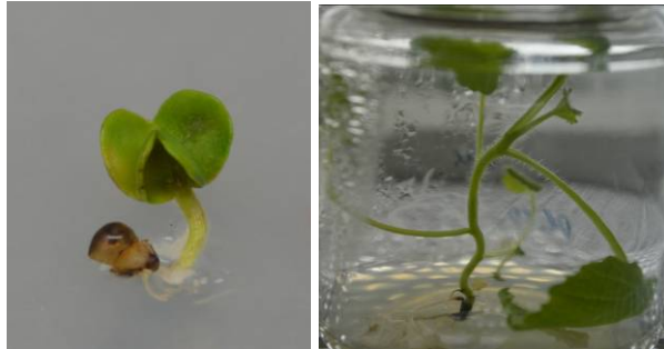
Рис. 1. Асептичні рослини виду Crambe steveniana : А – проростання асептичного паростка із насінини; Б – асептична рослина, що проростає на безгормональному живильному середовищі MS

пагонів при подальших спробах культивування гинула. На контрольному безгормональному середовищі утворювався лише один пагін, не відбувалось утворення калюсу, а укорінення пагону відбувалось через 10–14 днів після перенесення на свіже живильне середовище.