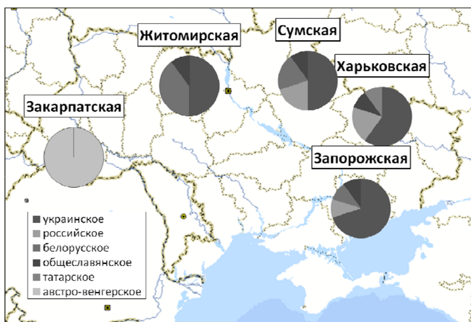
Рис. 2. Этническое происхождение фамилий в украинских популяциях (среди десяти наиболее частых фамилий)

Таким образом, фамилии объективно отражают миграции населения, сопровождающиеся изменениями этнического состава.