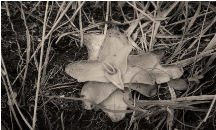
Рис. 1. Pinguicula vulgaris L. – товстянка звичайна (Бушанський заказник, Рівненська обл.)

Дослідження проводились в літній період 2010 року маршрутно-пошуковим методом із фотографуванням та складанням геоботанічних описів за загальноприйнятими методиками (Байдеман, 1974; Работнов, 1960; Голубев, 1982; Григора, Якубенко, 2005). Отримані результати опрацьовувалися статистично на ПК з використанням програм Microsoft Office Word та Microsoft Office Excel, 2003, 2007, номенклатура видів подана згідно Vascular plants of Ukraine (Mosyakin, Fedoronchouk, 1999).