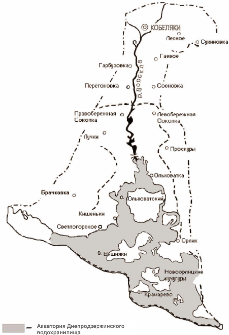
Рис. 1. Схема регионального ландшафтного парка «Нижневорсклянский»